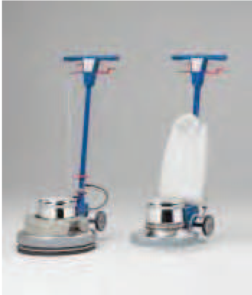
Cepillos columbus para cualquier aplicación